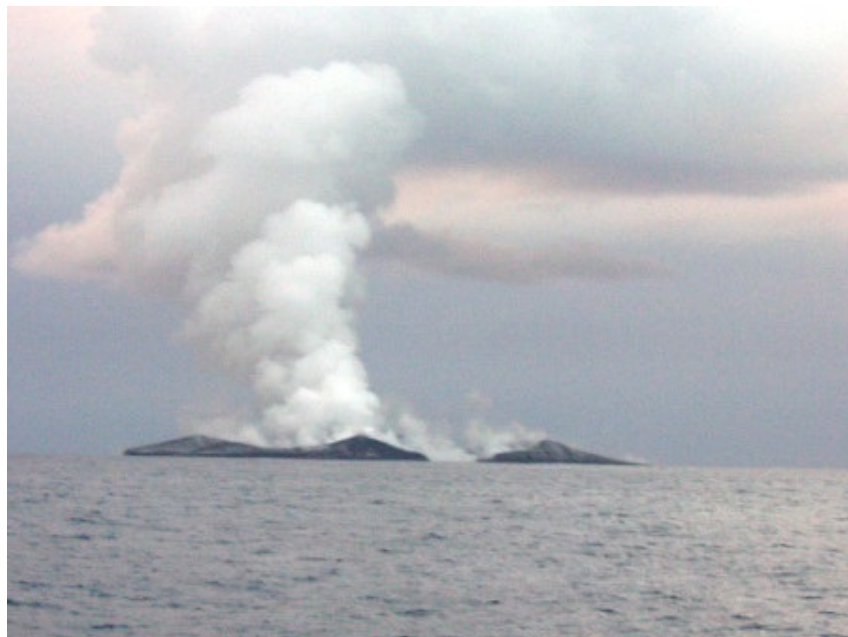
"פלומה" של אפר שחור