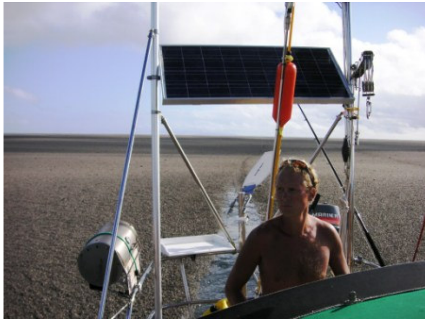
ואז הם הבחינו באפר וקיטור עולים מן הים